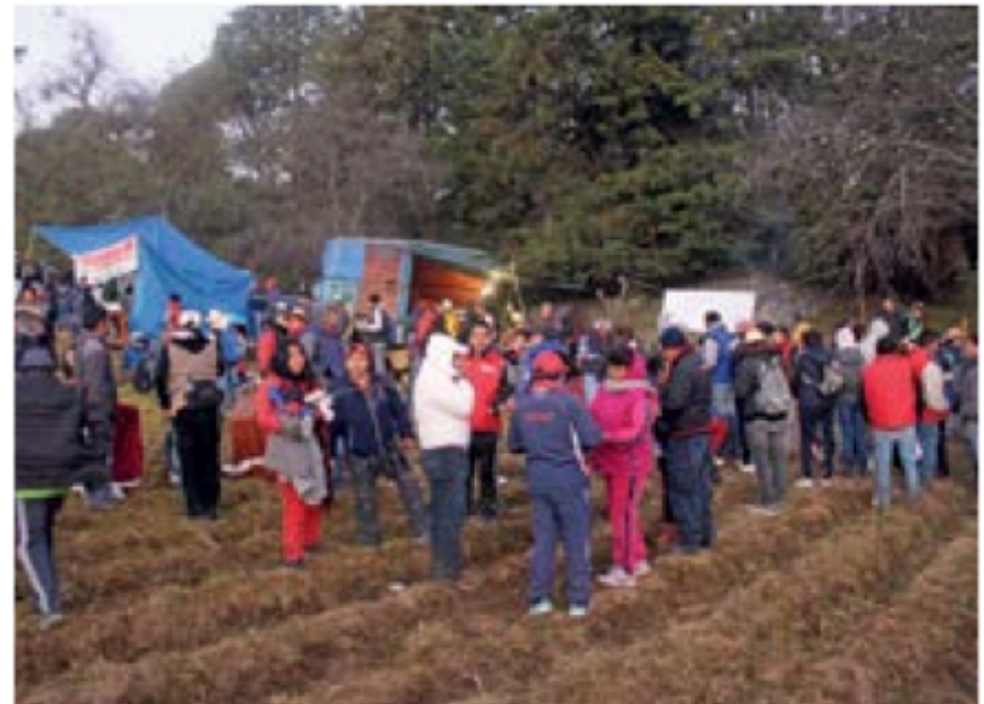
● Primera parada para desayunar en un paraje de Topilejo. 2017.

que se festeja la Epifanía, cuando Jesús se da a conocer, también popularizado como la visita de los Reyes Magos al Niño Dios. El 6 de enero continúa la fiesta y se lleva a cabo el cambio de mayordomía y es hasta el día 8 cuando emprenden el camino de regreso, para estar en Milpa Alta el 10 de enero, donde son recibidos con gran júbilo, comida y baile.