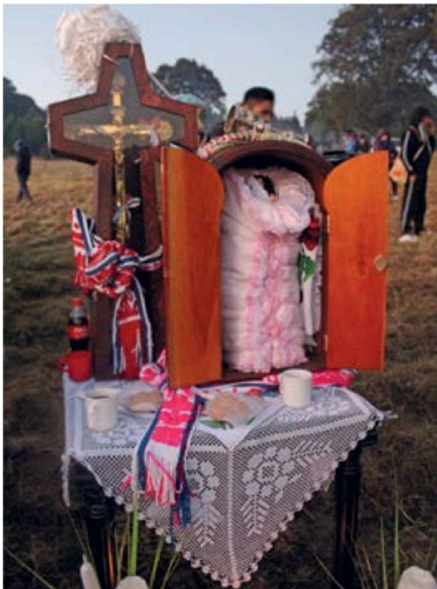
Las imágenes que cargan son tratadas con mucho respeto, se les cobija y se les alimenta durante el camino. 2017.

Chalma; a la gente se le ofrece un café con pan mientras se reúne la gente, muchos de ellos llevan nichos que guardan imágenes del Señor de Chalma o los santos de su devoción. El frío se va tornando cada vez más pesado, y como a las 2 de la mañana llegan los responsables de cargar las imágenes principales; de una forma muy solemne van envolviendo las imágenes en pequeñas cobijas para que “no les dé frío” (a la virgen solo la puede arreglar una mujer), mientras les pasan el sahumerio, las colocan dentro de su nicho, al cual amarran un ceñidor tejido en telar de cintura, para cargarlo con el impulso de su frente.