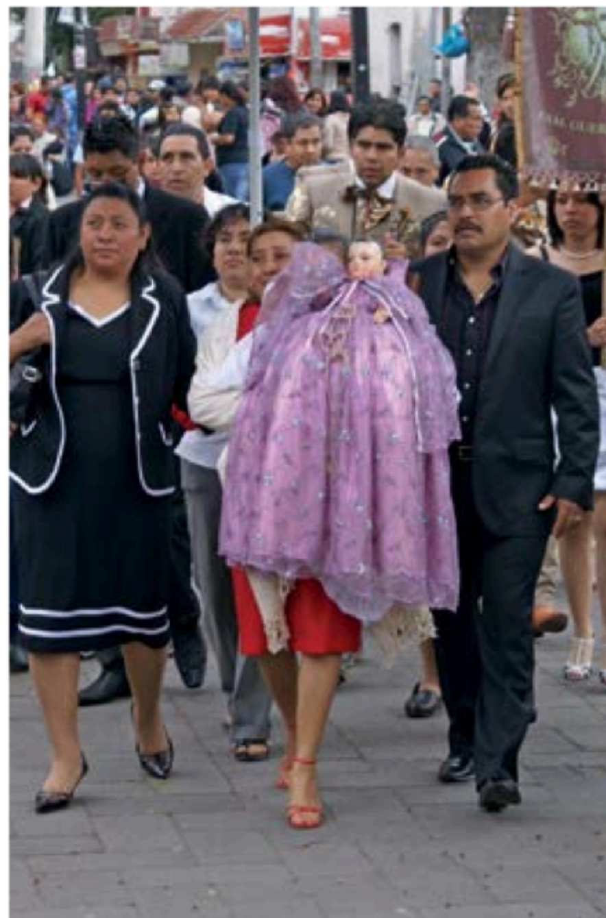
Los nuevos mayordomos reciben al Niño. 2010.