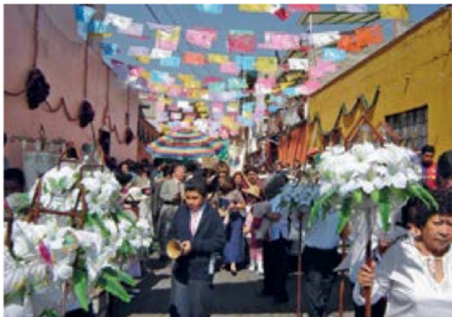
La gente se prepara para la ceremonia del cambio de mayordomía. 2009.

Posteriormente el nuevo mayordomo invita la comida a todos los que acompañan la celebración. La gente lleva sus pequeñas imágenes vestidas de diversas maneras, desde santos hasta chinelos, concheros o futbolistas. El Niño Dios comunitario permanecerá todo el año en la casa del nuevo mayordomo, y saldrá a visitar las casas de las personas que lo soliciten, pero siempre regresará a la casa del mayordomo en turno.